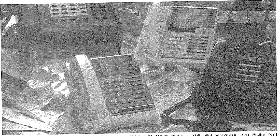
'84년부터 늘기 시작한 키폰의 시장은 매년 30%이상의 증가 추세에 있다.

양화가 시작되었다. 국산 전화기가 비약적인 발전을 하게 된 계기는 전화기 보급을 관급(官給)에서 사급(私給)으로 바꾼 체신정책의 전환이었으며, 1981년 1월 1일부터는 전화가입자가 직접 전화기모델을 일반시중에서 구입할 수 있게 되었다.