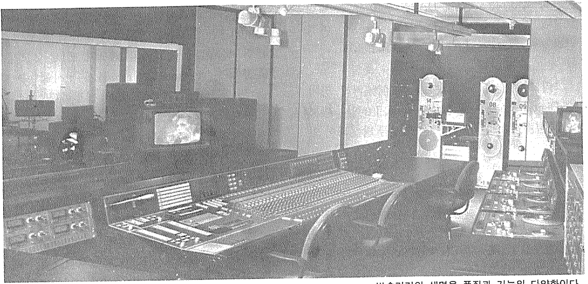
방송기기의 생명은 품질과 기능의 다양화이다.