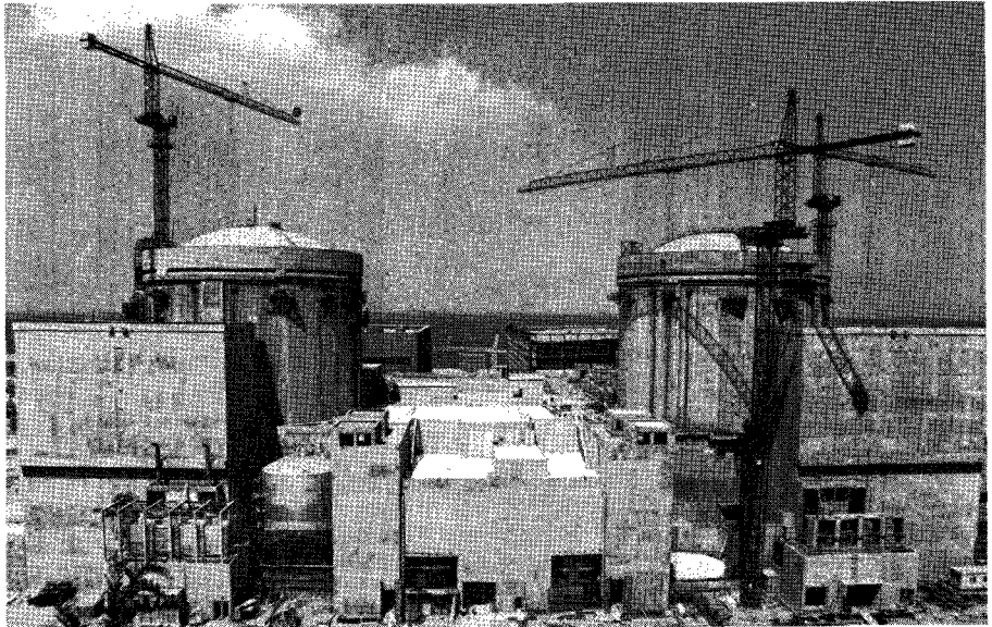
▶ 울진원자력 1, 2호기 건설당시 광경

構成은 原子力이 34.5%, 有煙炭은 32.8%로 主宗이 될 展望입니다.