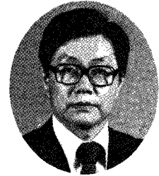
安 秉 華 (韓國電力公社 社長)

本稿는 지난 10월 28일 서울대학교 강당에서 열린 韓國 原子力學會 第22回 定期總會 및 學術發表會에서 특별강연 한 내용이다.