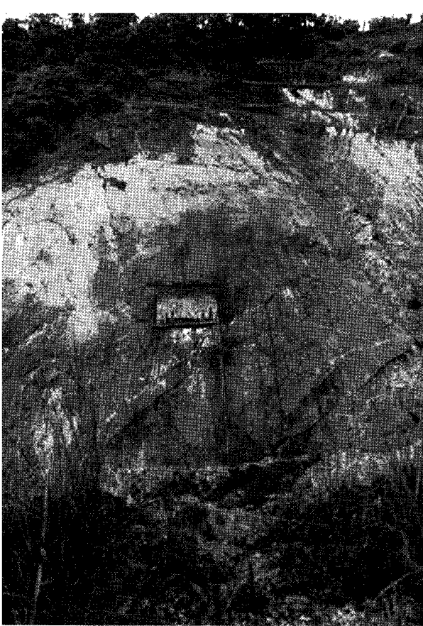
▲Oklo 原子爐 地域.

갖고 있었던 것을 알아냈다. 모든 船積分을 計算하여 보면 우라늄235의 不足量이 約 200 kg 정도 되었다. 그밖에도 問題地域의 原鑛에 대한 精密分析 결과 處理되지 않은 原鑛에서도 非正常的인 狀態를 찾아낼 수 있었다. 數年前에 파악된 深査用 試錐孔으로 부터 採取된 코어 부스러기(Debris)에서 同位元素의 含量이 0.04퍼센트 정도로 낮은 우라늄이 發見되었으며, 科學者들은 그들이 매우 중요한 現象을 다루고 있다는 認識을 갖게 되었다.