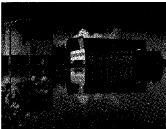
▲ 캐나다 Point Lepreau 原産 전경.