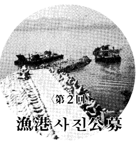
〈第2回〉 漁港 사진公募

「건설법」이 같은 제도개선 건의 이유도 첫째 동종구조물공사라도 불가피하게 분할 발주되어야 할 경우가 있다고 지적, 이 경우에도 수의 계약사유에 해당되는 수의계약으로 집행할 수 있다고 밝혔다.