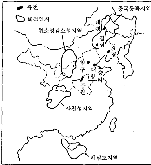
〈그림 2〉 중국의 주요 가스 산지

석유 화학이라고 하지만 비료 생산이 대부분이며 8개의 플랜트가 있다. 각각 암모니아를 연간 30만톤씩 생산하고 있으며 1986년에는 39억 ㎥ 의 가스를 소비했고 그 외에 1000개 이상의 소규모 비료제조공장이 있지만 가스의 소비규모는 명확치 않다. 1989년 화학 비료의 생산량이 6천8백만톤에 이를 것이 예상되지만 아직도 1천만 톤 이상을 수입