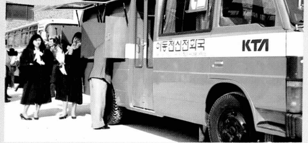
▲ 대학졸업식장에서의 이동통신전화국