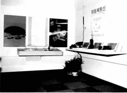
▼ 삼성전자 상설전시장의 이동체통신 부스