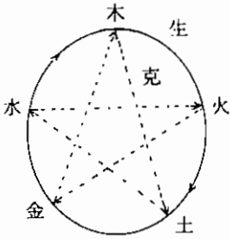
〈丑 3〉 五行圖表

陰：下，內，夜，秋冬，寒涼，濕潤，重，暗，降，靜，抑制，衰退 陽：上，外，晝，春夏，溫熱，乾燥，輕，明，升，動，興奮，亢進