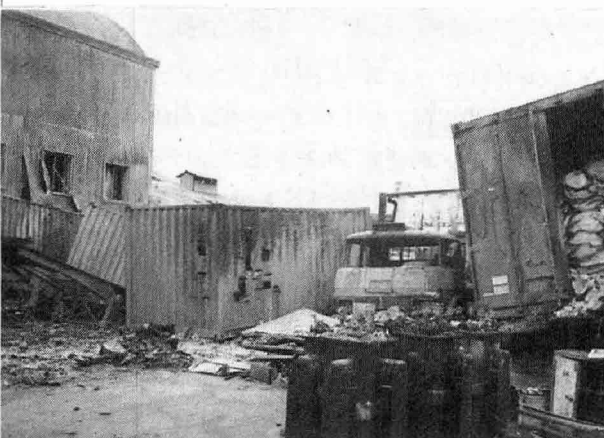
창고건물 전면에 있던 컨테이너 내부의 화공약품이 폭발적으로 연소되었다.