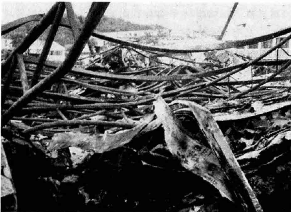
가연성 재료는 모두 타버리고 건축재로 쓰인 철재만 앙상하게 남은 창고건물.

사. 자연발화는 물질자체의 축적된 열에 의해서 자연적으로 발화하는 현상으로 물질의 종류에 따라 발화조건이 다르므로 취급물질에 상응하는 대책이 필요하다. ㉞