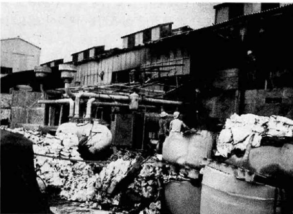
화공약품이 타면서 내뿜은 열기로 본공장 일부가 탄 모습.