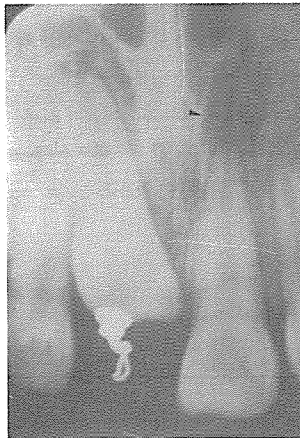
〈그림 3〉 비구개공의 측벽에 의해 치근단 병소처럼 보인다.