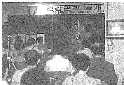
健協 서울특별시지부는 9월 건강관리 공개강좌를 오는 9월26일 화요일 오후 2시부터 홍보관에서 갖는다.