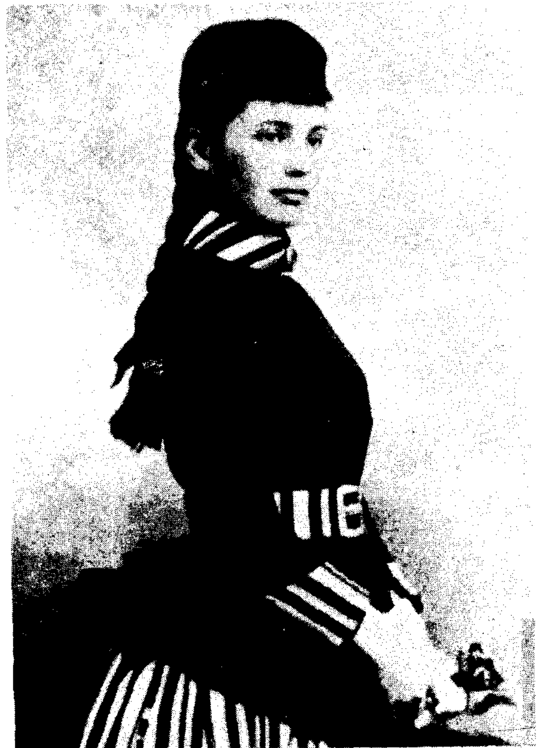
〈그림 2〉 Fish wife tunics

가리발디 블라우스는 19C末에 少女들이 착용한 muslin으로 만든 붉은색 블라우스였다. 이것은 이탈리아의 가리발디라는 제독이 입는 붉은색 블라우스