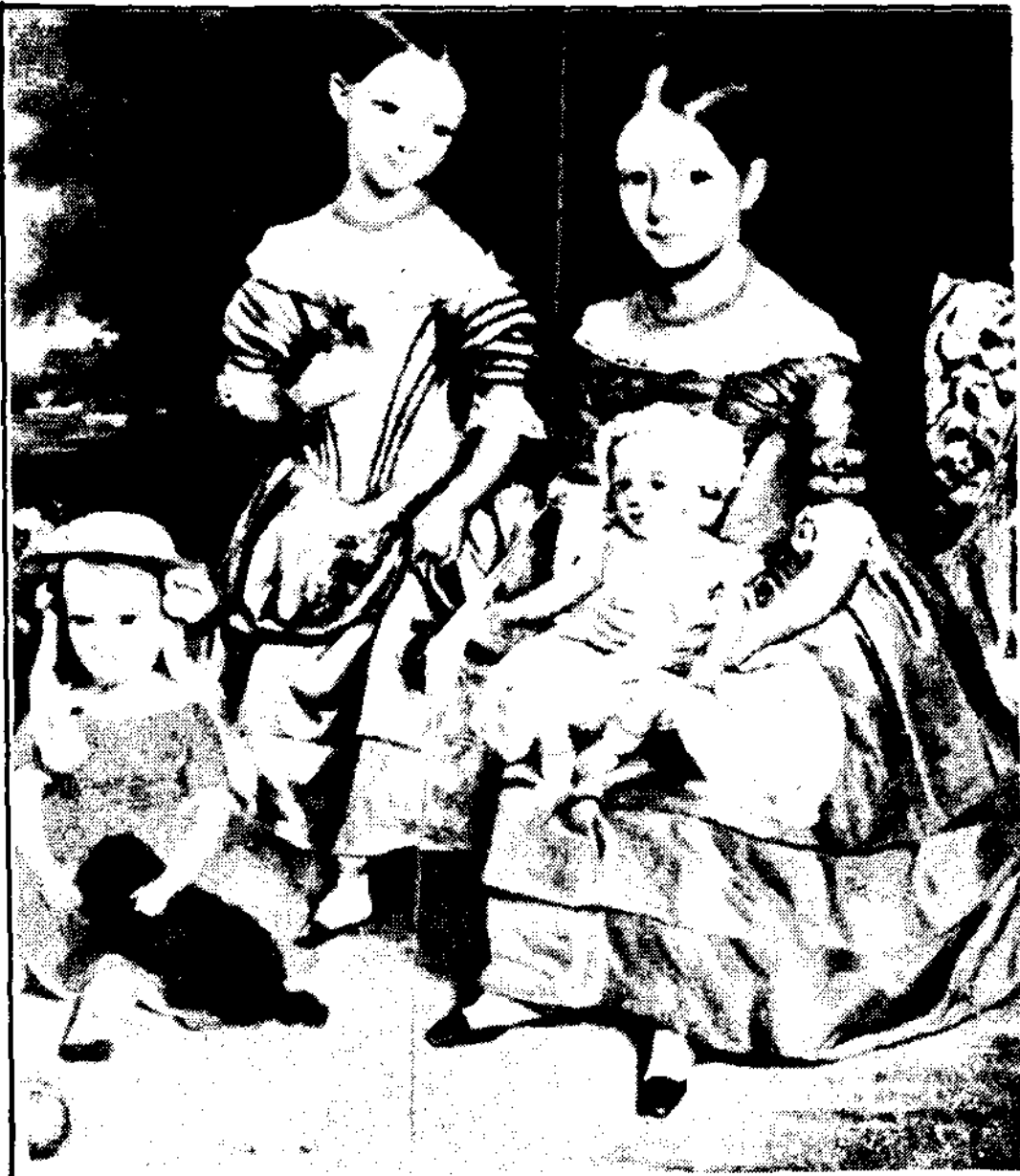
〈그림 1〉 Frock

Phillis cunnington & Anne Buck, 「Children's Costume in England 1300-1900」 p1.