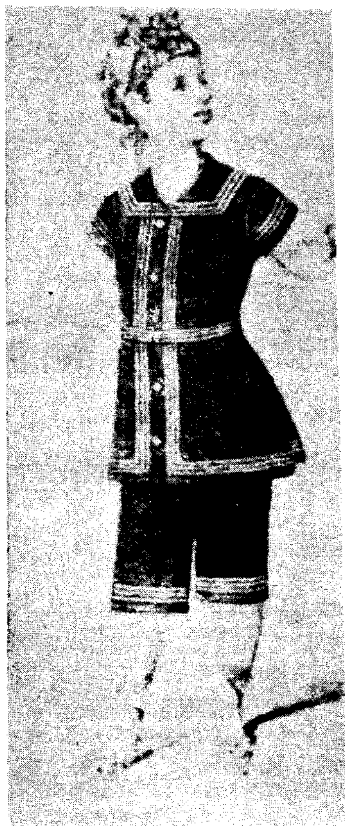
〈그림 7〉 Bathing Costume

Phillis cunnington & Anne Buck, 「Children's Costume in England 1300-1900」 plate 30.