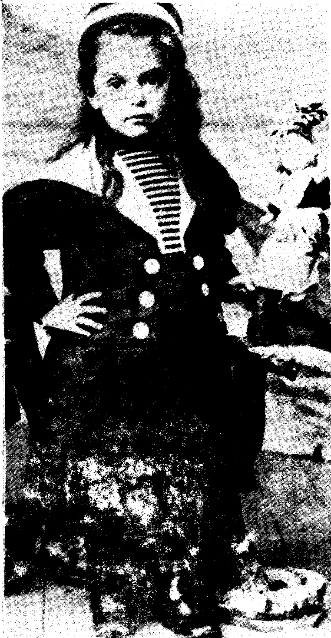
〈그림 3〉 Sailor Suit Francois Boucher, 「20,000 years of fashion」, p.404.