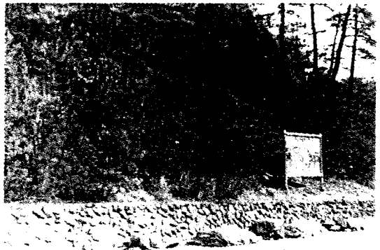
Photo 2. Advancing forest edge type with Pinus densiflora beside access road in Kaya Mountain National Park.