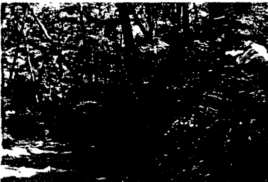
Photo 1. Edge vegetation beside trail of Pinus densiflora forest in Kaya Mountain National Park.

환경유형 V는 홍류동계곡 홍도문뒤쪽의 남사면으로 전진형주연부식생이 발달하고 있었다. 주연부수종으로