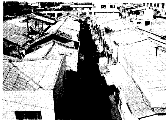
〈사진2〉 黃鶴洞板子村 全景

이 地域은 8,910㎡에 38棟의 老朽木造 1~3層型 스테이지붕 建物이 하나의 건물처럼 連結되어 있으며 626世帶 1,924名이 住居하고 있으나 周邊 消防通路가 未洽하고 이웃市場과 連繫될 뿐만아니라 바로 隣接해 家具店, 酒店等이 密集되어 있어 火災發生 憂慮가 顯著하고 한번 火災가 發生하면 急激한 延燒擴大가 豫想되어 火災豫防 및 鎮壓 對策을 講究하기가 매우 어려운 脆弱한 슬럼地域이다.