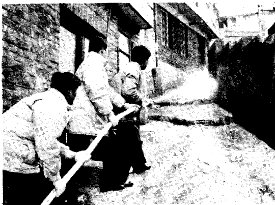
〈사진4〉非常消火裝置活用 消防訓練

隊員中에서 希望하는 사람은 義勇消防隊員으로 任用하고 女性隊員은 名譽消防官으로 任用하여 消防弘報要員化 하므로서 불조심 生活化 運動을 底邊擴大할 수 있도록 誘導하여 效率的인 豫防과 鎮壓消防 態勢를 갖추도록 한다.