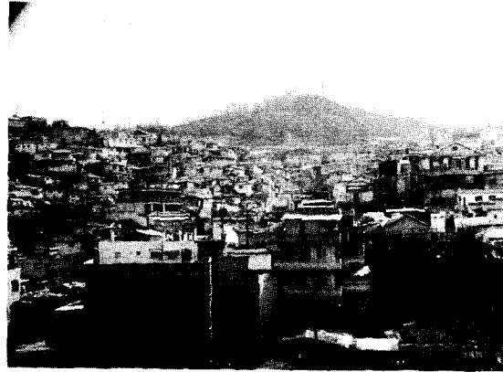
〈사진1〉 新堂3洞 高地帶 全景

이 地域은 傾斜度가 急激하고 消防車 進入이 困難한 高地帶로서 面積은 40,000㎡에 達하며 建物棟數는 483棟에 1,300世帶가 住居 1棟當 平均 3世帶가 入住하고 있으며 人口數는 5,273名으로 1棟當 平均 11~12名이 居住하여 슬럼地域을 形成하