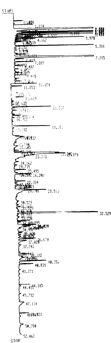
Fig. 1. Gas chromatogram of strawberry jam prepared by evaporation(Control)