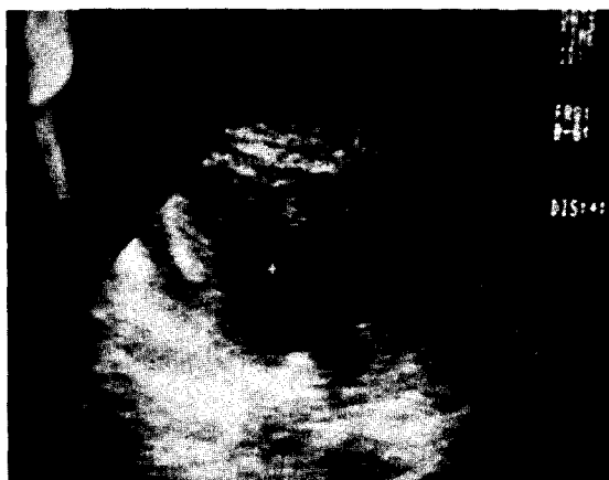
Fig. 2. Preoperative echocardiogram; Moderate amount of fluid collection in pericardial space.

행하여 응고되지 않는 혈액이 천자되었다. 관통성 심장손상 7예에서 수상후 수술시작까지 소요된 시간은 15분에서 2시간 45분으로 평균 1시간 26분이었으며 (Table 4), 특히 7번예에서는 shock상태와 중심 정맥압의 현저한 증가, 수상부위와 방향등에 의해 심낭압전의 진단하에 바로 수술실에 들어갔으며 이때 심장정지가 와서 심폐소생술을 시행하면서 개흉을 하였다.