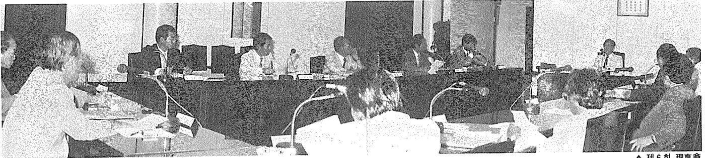
▲ 제 6 회 理事會

본협회는 6월27일~8월27일 기간중 건축사특별전형시험(2급건축사) 대비를 위한 연수를 실시키로 하고 1차 연수를