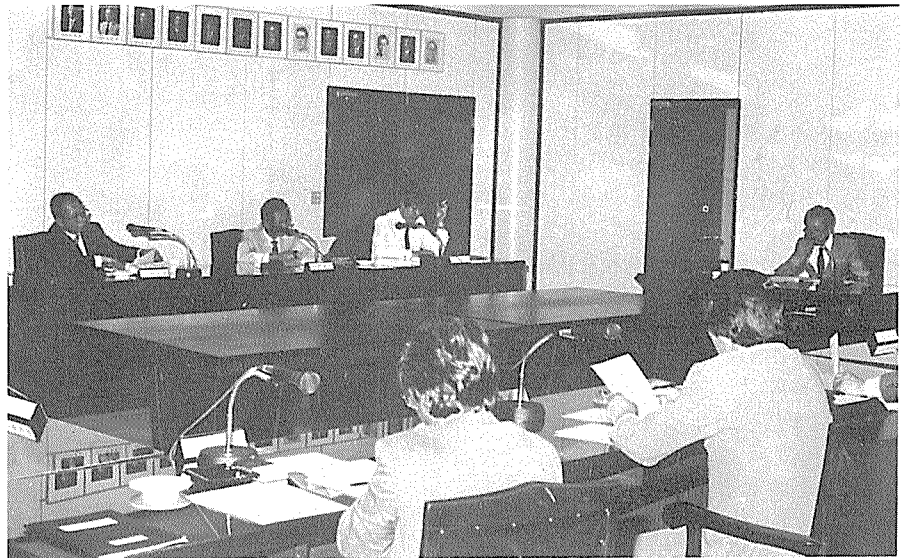
제 4 회 이사회 ▲