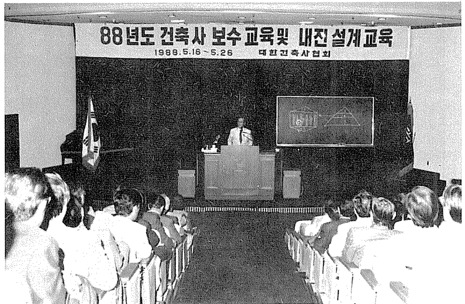
88년도건축사연수 및 내진설계교육 ▲