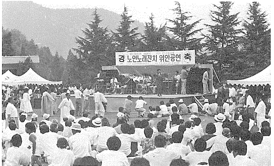
경로효친양양을 위한 연예인초청공연 (구미분소)

경상북도지부 구미분소는 제3회 구미문화제 기간중인 지난 9월10일, 88서울올림픽 성화맞이 행사의 일환으로 구미시 금오산 잔디밭에서 연예인들을 초청 분소관내 노인 노래잔치 및 위안공연행사를 배풀어 경로효친 양양에 기여하였다.