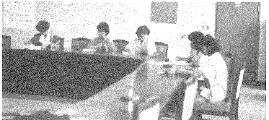
1988년도 정기감사에 대비한 직원실무교육 실시 (경남지부)

8월13일 (토) 오전10시부터 지부직원 4명과 8개분소 직원 8명등 12명에게 1988년도 정기총회에 대비한 감사지침시달 및 직원실무교육을 실시하였다.