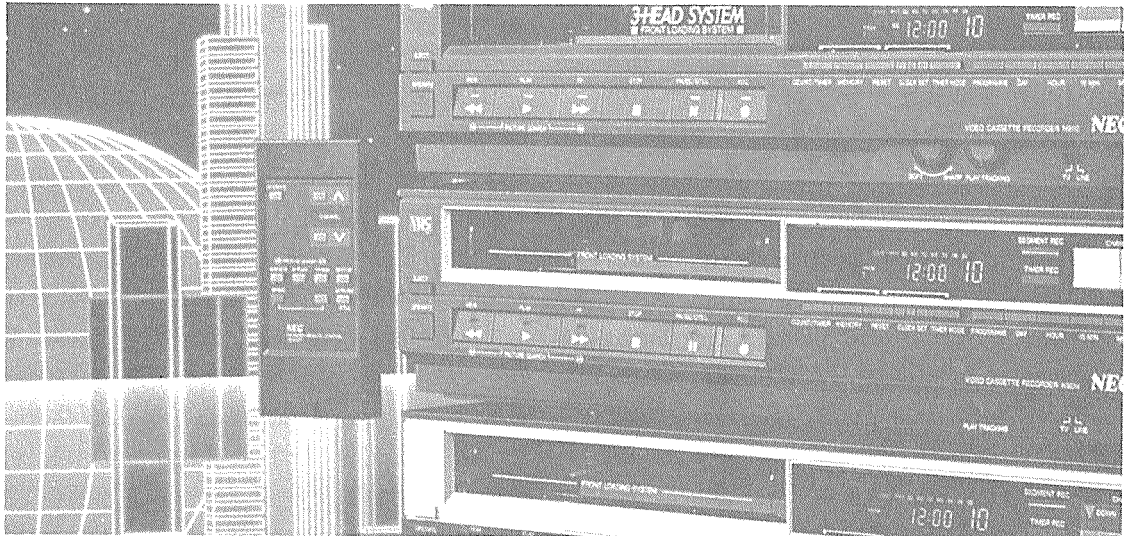
카오디오의 범주에서 일보 발전하여 머지않은 장래에 종합 Car Electronics로의 발전이 예견된다.