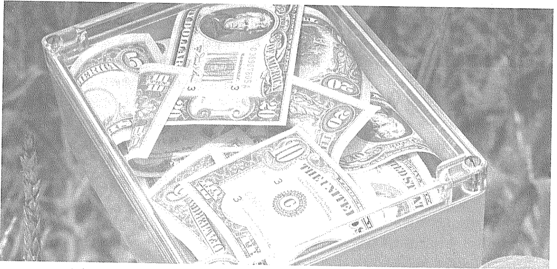
급속한 원화절상의 대책으로 생산성향상, 원가절감, 생산시설 자동화, 고부가가치 제품 개발 등을 들 수 있다.

나아가서는 産業構造의 高度化 촉진 및 産業體質 강화, 國民經濟의 對外信認度 제고 등 긍정적인 효과도 있다.