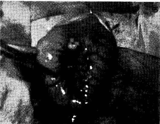
사진 3. 장 문합이 완료된 상태.

없고 비교적 신선하였으므로 조심스럽게 중적부위를 공장쪽에서 서서히 당기면서 결장쪽에 밀어 내었더니 중적이 풀리기 시작하였으나, 마지막 기시부를 펴서 조사해보니 이미 두곳에 천공이 생겨 있었고, 장내용물이 흘러나오기 시작하였다. 하는 수 없이 피사가 인정되는 20cm 가량의 장을 절제하기로 했다. 장 간막에 흐르는 혈관들을 3-4개씩 2-0 Cat gut로 결찰 후 피사부위 양단에 장감자를 장착하고 장의 양단을 절단하였고 생리적식염수액+항생제로 장을 깨끗이 세척한 후 장 물합술을 실시하였다.