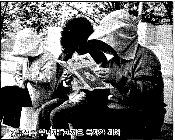
② 휴식중 부녀자들까지도 독자카 되어