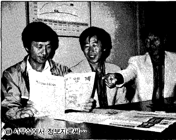
① 사무실에서 정보지로써...

월간양계는 이를 위해 양계인의 끈적끈적한 전통을 거울삼아 새로운 각오로 참신한 기획, 전문기자의 양성 등 부단한 노력으로 대처해 나갈 것이다. 양계인으로 월간양계를 더욱 가깝게 할 수 있도록 배전의 노력을 기울일 것으로 다짐한다. 양계