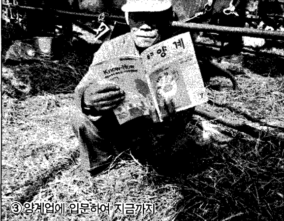
③ 양계업에 입문하여 지금까지