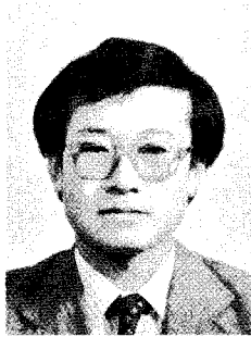
이 주 양 (주)미원 사료사업본부 사료영업과

해방후 우리나라는 비교우위론에 입각한 수출주도형 공업화 우선 정책으로 고도성장을 이룩, 한국축산업은 농가부업적·자급자족적 경영형태에서 상업농 형태로 변천, 이윤과 자본을 추구하는 전업·기업화가 추진되어 이미 비육우를 제외한 전축종은 상당부분 전·기업화되었고, 국민소득의 증가로 축산물은 주곡에 버금가는 필수식품이 되었으며 이러한 추세는 경제발전이 따라 지속될 것이며 축산업의 발전은 국가산업의 근간을 이루는 농민의 소득증대, 농촌발전은 물론 식량안보 및 효율적 국토이용 차원에서 대단히 고무적인 일이다.