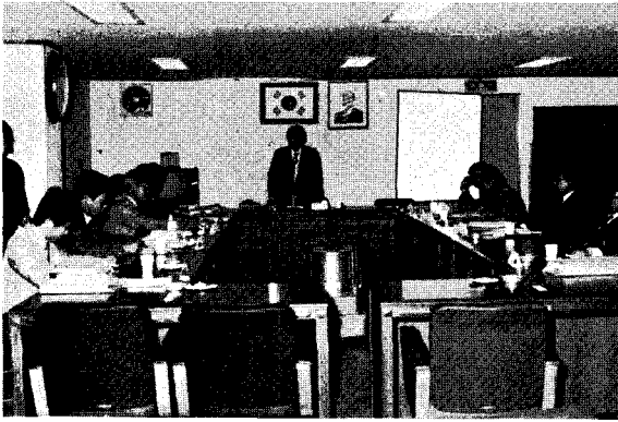
△ '87년도 제3차 이사회

본회는 지난 12월21일(월) 축산회관 회의실에서 '87 제3차 이사회를 개최하였다.