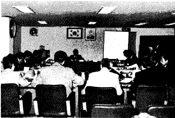
△ 87년도 소비홍보협의회

본회는 '87 소비홍보협의회를 12월 24일 오후 4시에 축산회관 회의실에서 개최하였다.