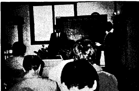
△ 광주채란분회가 정기총회를 가졌다.