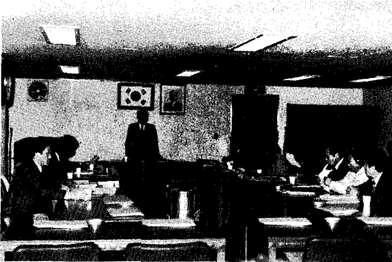
△ 87년도 제 1차 양계산물가격안정협의회

본협의회는 양계전망을 관측하여 조기에 경기상황을 예고하고 적정한 생산조절로 양계산물가격을 안정시켜 우리나라 양계산업발전에 기여함을 목적으로 하며, △ 양계산업 경기관측 △ 종계수급조절, △ 닭사육수수조절 △ 초생추·육계·계란가격안정 △ 대정부(기관) 건의 및 유관기관, 단체협조사항 △ 기타 업계발전에 관한 사항을 검토하고 협의하는 기능을 하게 된다.