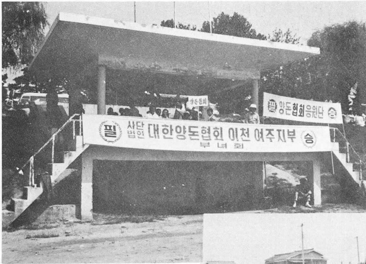
축산인 체육대회때 이천·여주 지부 양돈인 부녀회 응원단

산인 체육대회때나 양돈인 부녀회에서 돈육요리경연대회 시식회를 연 2회 실시하기도 해 지난 2월 대의원 총회에서 돈육소비 홍보상을 수상하기도 했다.