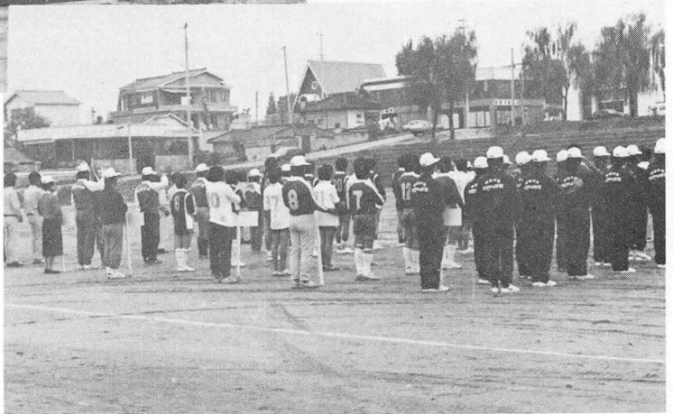
이천·여주지부는 축산인 체육대회 때마다 양돈인 부녀회에서 돈육요리경연대회 시식회를 연다.

'88년말 현재 이천군 양돈 농가는 1천 9백 73호이고, 부업농을 제외한 전업규모로 구성된 회원별 평균 사육두수는 100두 13명, 101~299두 13명, 300~499두 15명, 500~999두 8명 1,000~9,999두 8명, 10,000두 이상 4명으로 지부 통