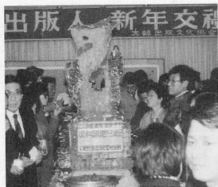
1월6일 출협 강당에서 베풀어진 '출판인 신년교례회'.