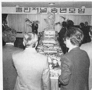
'출판저널'의 송년모임이 구립 11일 성황리에 베풀어졌다.

출협이 마련한 이날 모임에는 200여명의 출판인과 사회 각계 인사들이 참석, 交禮했다.