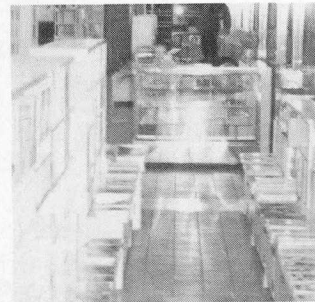
강남 고속버스터미널 지하철역 지하1층에 새로 문을 연 '한가람문고'.