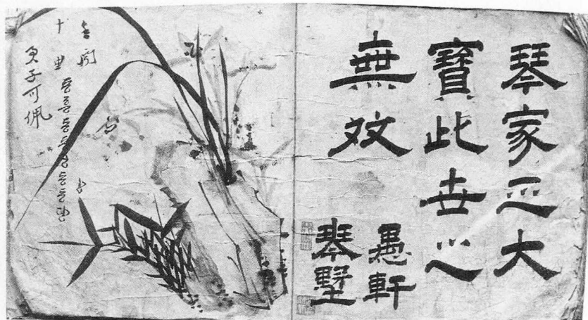
「愚軒琴譜」 뒷장에 써여 있는 휘호. (낙관은 소장자의 호와 이름임)