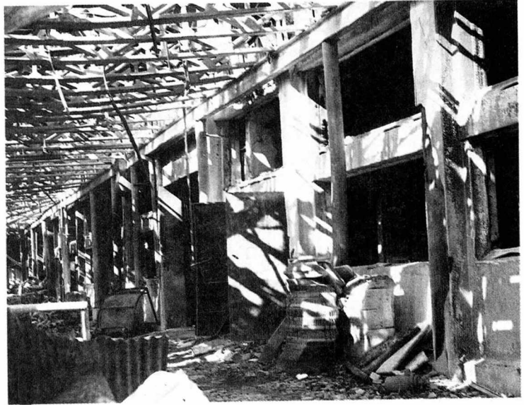
▲16동, 17동 사이의 통로-철골트러스로 연결하고 2층부분을 생산부 일부로 사용하고 있었으나 마주보는 외벽의 개구부로 쉽게 연소된 것은 철골트러스 때문인 것으로 판단된다.

2) 또한 옥외컨베이어시설을 타고 확대된 불길은 14동(생산2부)과 15동 사이의 외벽을 타고