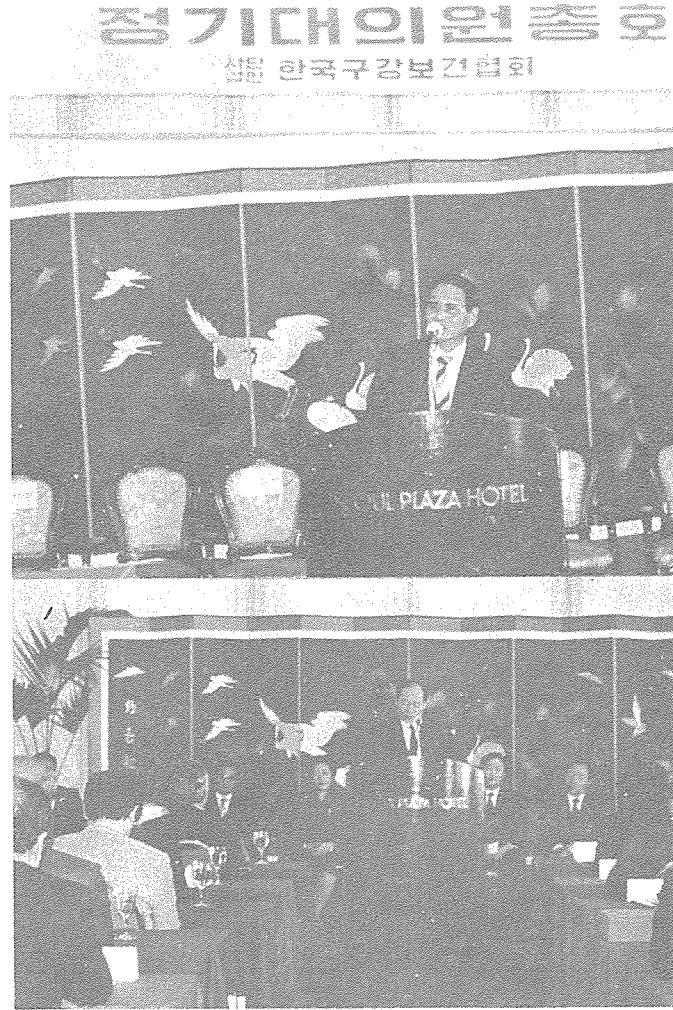
< 成年을 맞은 한국구강보건학회 정기총회 >

특히 금년부터는 愛敬산업주식회사의 특별회비 지원으로 지난해 보다 무려 54.3%인 2천6백98만2천원이 증액된 7천6백66만4천원의 신년도 예산이 확정되므로 國民口腔保健向上을 위한 각종 사업이 더욱 활발하게 전개될 수 있게 되었다.