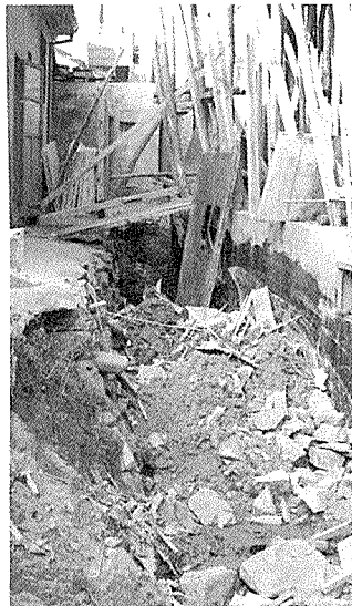
서울지부회원들의 수해지구 건축물 안전진단