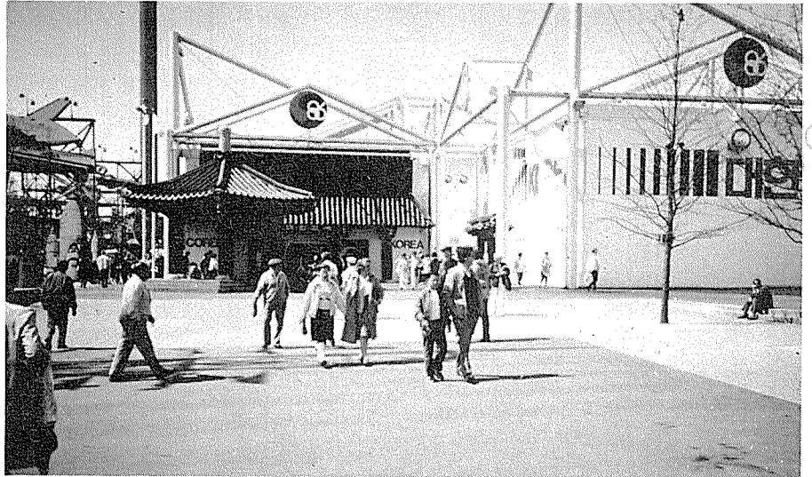
포코트에서 본 한국관 정면

Report Production of Display Space by Han, Do-Ryong