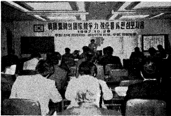
△ 수입개방에 대처키 위한 심포지움

한국가금학회(회장 오세정)와 본회가 공동으로 주최 하고 (주)한일농원이 후원한 「수입개방에 대한 한국 양계의 국제경쟁력 강화방안」에 대한 심포지움이 10월 28일 상공회의소에서 성대히 개최되었다.