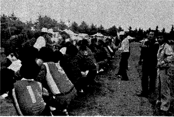
△ 전북지부 체육대회

한편 전북지부에서는 닭고기소비 홍보사업으로 체육대회에 참석한 내빈 및 관람자에게 튀김닭 도시락을 별도 300개를 만들어 전달했다.