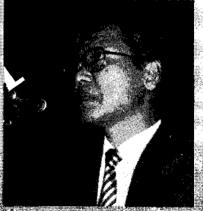
표 2. 우유의 생산 및 소비증가율 (%)