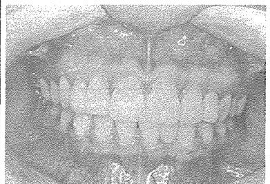
사진 5. 치료후 정면