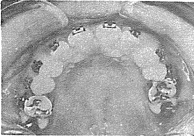
사진 1. 치료전 상악

상하악 치아의 정중선은 일치되지 않았지만, 양호한 교합관계를 보였고, 기능적인 이상도 발견되지 않았다.