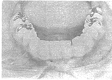
사진 2. 치료전 하악