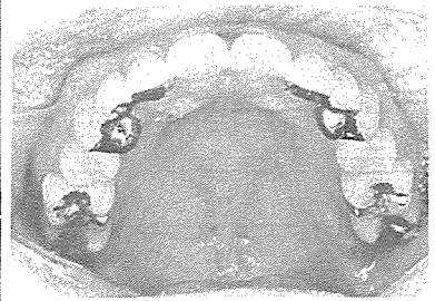
사진 4. 치료후 상악