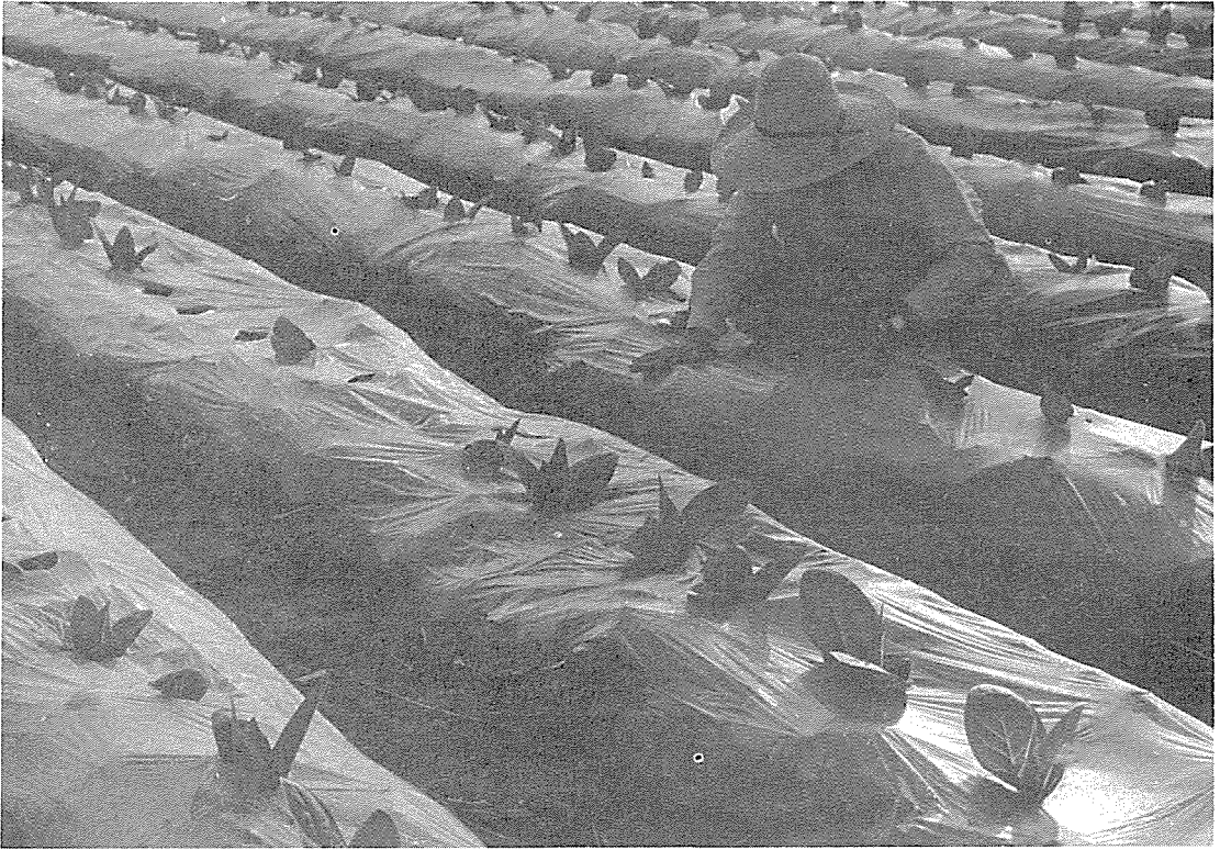
경 작 전덕배(국립의료원) PENTAX ME Super 60 / 450mm 온양 민속마을에서 촬영

· 밤은 새벽을 기다리는 가장 가까운 친구이듯 추운 겨울은 또 봄에게 자리를 건네주고 물러선 다.