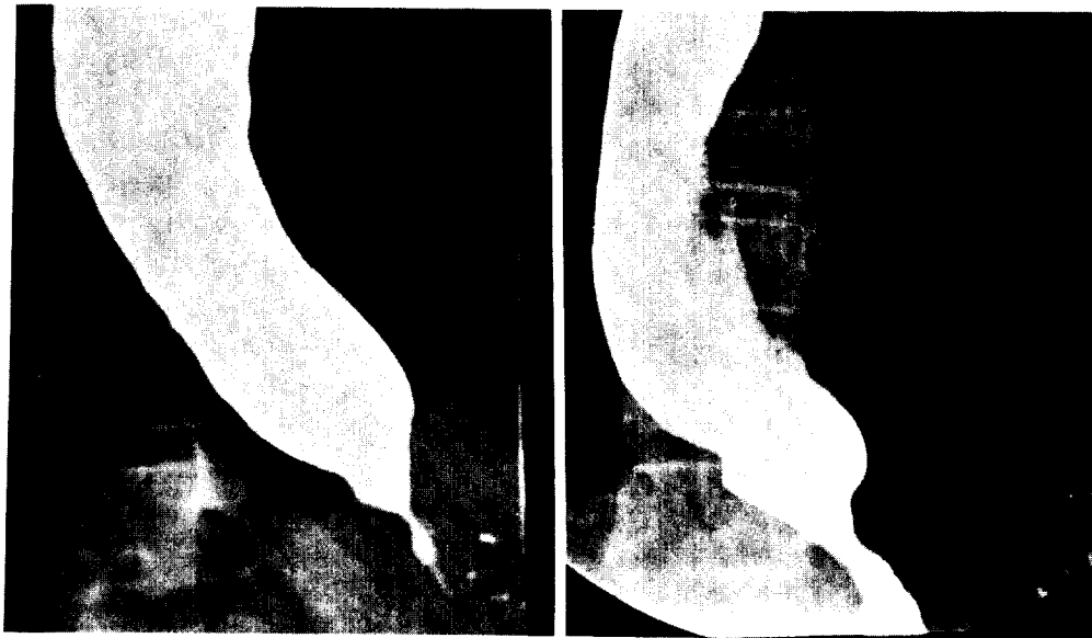
Fig. 1. Preoperative (left) and postoperative (right) esophagogram in 14 year old boy

식도 아칼라시아의 치료에 있어서 식도 확장술은 1674년 Thomas Willis가 고래뼈로서 확장술을 시도한 만큼 8) 많은 학자들에 의해 1차적으로 시도되고 있는 것이 사실이다 15,24) Vantrappen와 Hellemans 15) 는 대부분의 환자에서 확장술이 외과적 근절개술보다 좋은 방법임을 주장하고 다만 1) 수치의 공기 확장술(Pne-