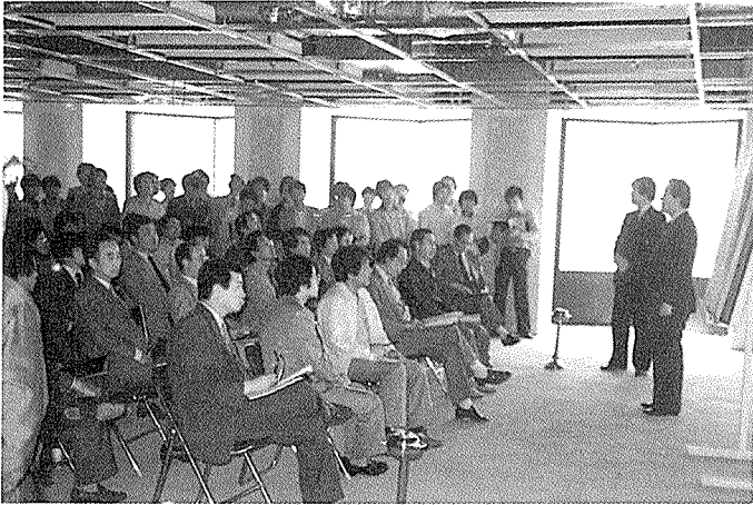
건축물시공현장견학단 / 서울지부 '86건축사간담회 및 도민 한마음운동 실천결의 / 충북지부