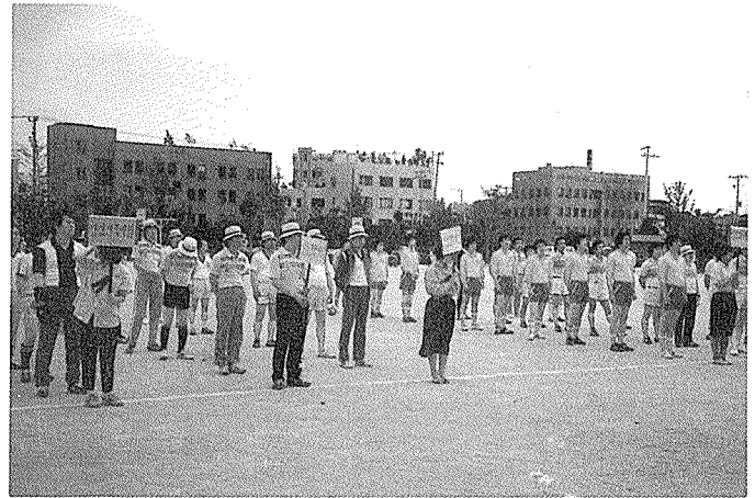
자매결연마을 대표에게 성품 전달 / 충남지부 지역단위건축사체육대회 / 서울지부