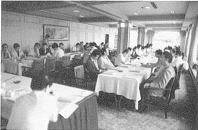
울산관광호텔에서 개최한 전·현직직원 확대간담회