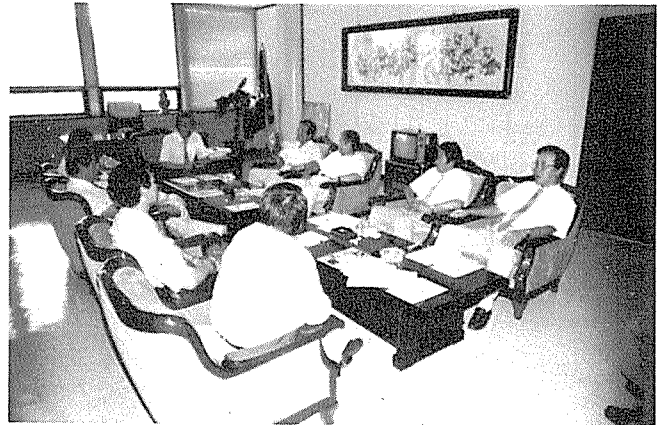
임원협의회 (8월 8일)