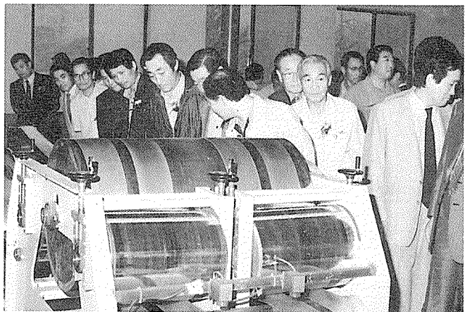
생산시설을 시찰하는 본협회 전·현직 임원일행