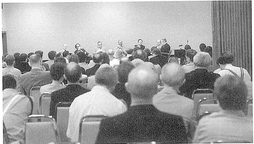
AIA 회의장면. 그들은 학교교육에 대한 잘못된 것, 앞으로의 해결 방식에 대한 결론을 찾는다.