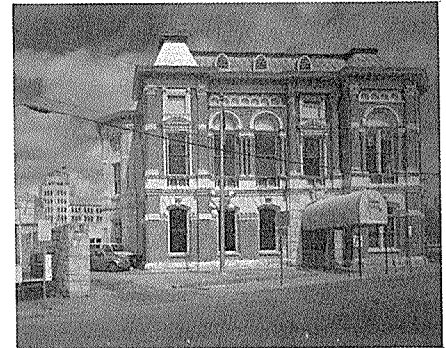
산 안토니오 시가에 있는 던베린 빌딩. 볼란서 풍의 영향을 받은 장로교회 건물