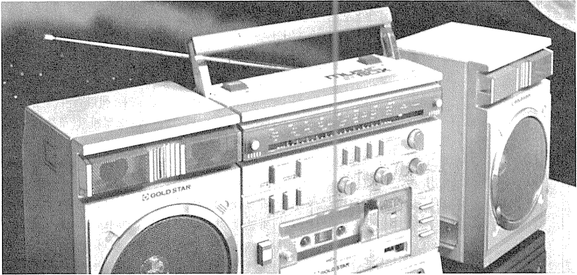
꿈의 오디오라는 CDP는 광학, 반도체, 레이저, 디지털, 진동 등의 다양한 기술의 총합체이다.

振動을 줄이는 관점에서 「無共振CDP」란 Catchphrase를 내세운 제품이 등장하고 있다. 현재까지 防振(Antivibration)은 Car-CDP의 주요기술로, 그리고 Portable CDP에서 관심을 갖던 기술인데 이제는 Home-CDP까지 확산된 것이다.