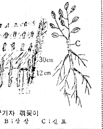
구기자 뿌리 및 생장 모습 A: 상수 B: 상상 C: 신묘

구기자의 施肥量 (10 a 당) Table content: 1회(7월중) 2회(9월중) kg. 800, 600, 1200, 400, 400.