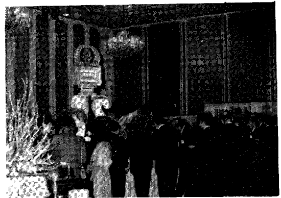
△ 롯데호텔 2층 크리스탈볼룸에서 리셉션 광경

학계, 업계, 단체 등 관련인사 150여명이 참석한 이날 리셉션에서 조지 홀래글회장은 「전통적 우방인 한국의 관련업계의 발전을 기원하며 오늘의 뜻깊은 자리가 양국국민의 우호와 발전으로 지속되길 바라며 축배를 들자고」 말하고 시종 화기애애한 분위기 속에서 리셉션을 마쳤다.