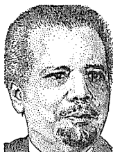
수교훈장 光化章을 주었다.