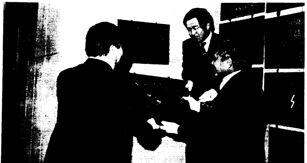
'85. 12. 27 韓國에너지協議會 懸板式