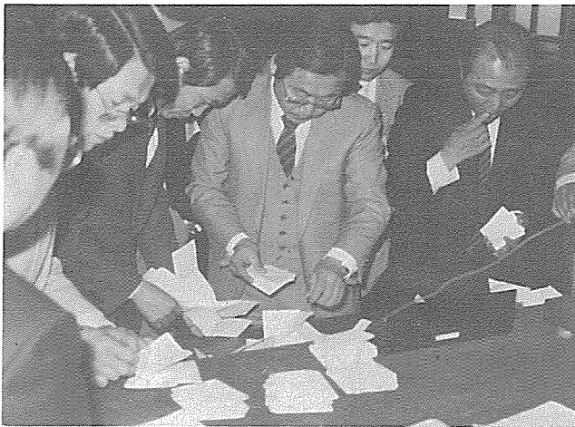
〈참석 대의원의 관심이 집중된 가운데 개표가 진행되고 있다.〉

회장단 선출에 있어서는 입후보자의 출마에 대한 소신을 들은 다음 투표에 들어 갔는데 투표결과 尹興烈 후보가 77표를 획득, 회장에 선임되었으며, 예산안(1억 8 백여만원)을 집행부원안대로 통과시켰다.