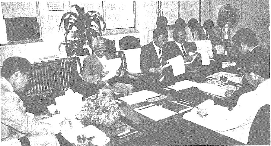
부리핑을 받고 있는 李海元장관(사진: 좌단)

李海元보건사회부장관은 지난 7월9일 오후 4시, 尹成泰기획관리실장, 李晟雨 의정국장, 柳元夏보건국장, 申暉鎮만성병과장, 方玉均계장등 관계관을 대동하고 寄協 및 健協을 방문했다.