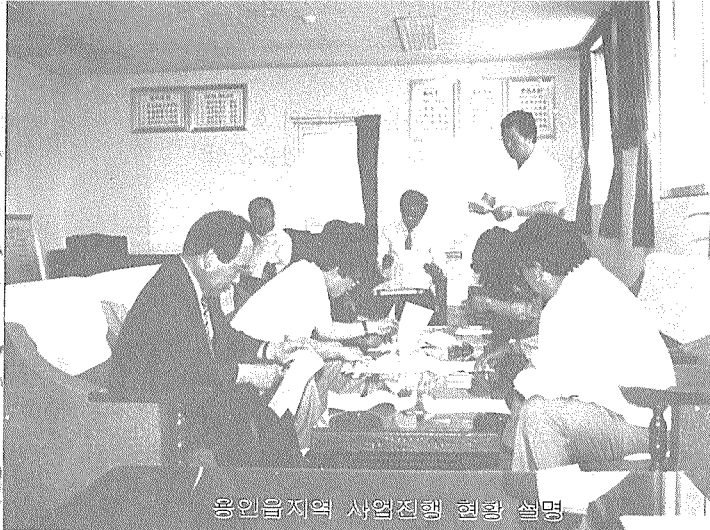
용인읍지역 사업진행 현황 설명