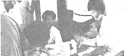
오지의 현지주민들을 대상으로 현장에 직접 출장하여 검진사업을 펴온 健協 인천지부

부는 지난 9월11일부터 27일까지 인천시 농업협동조합원과 가족들을 대상으로 종합 건강검사를 실시했다.